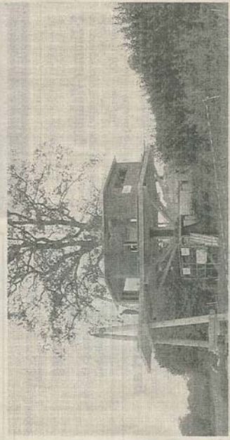
Der Balkon, die sechs Aussenwände und das Dach sind bereits fertig montiert. Über den Winter kommen die Isolations- und Innenausbauarbeiten an die Reihe.