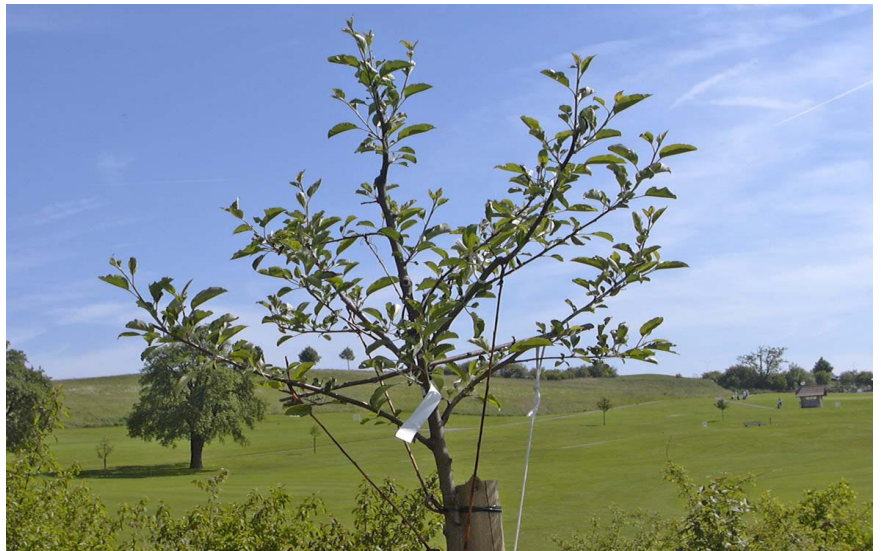
Die Hochstammbäume sind auf Amreins Hof zu einem wichtigen Betriebszweig geworden. (ek)

„Bei uns hat jeder Baum sein eigenes Aroma“, bestätigt Amrein. Unter anderem findet man auf dem Neuhof längst vergessene Apfelsorten wie die Schafnase und den Hansueliapfel. Bei den Birnen stechen Sülibirne und Ananas von Courtray ins Auge. Und unter den Zwetschgenbäumen hat es gar einen Lützelsachser und eine Schönenbergzwetschge. Allerdings sind die meisten Bäumchen erst drei bis fünf Jahre alt. Entsprechend gering sind vorderhand