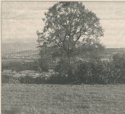
Um diese 30 Meter hohe Eiche auf dem Neuhof wird ein Baumhaus gebaut.